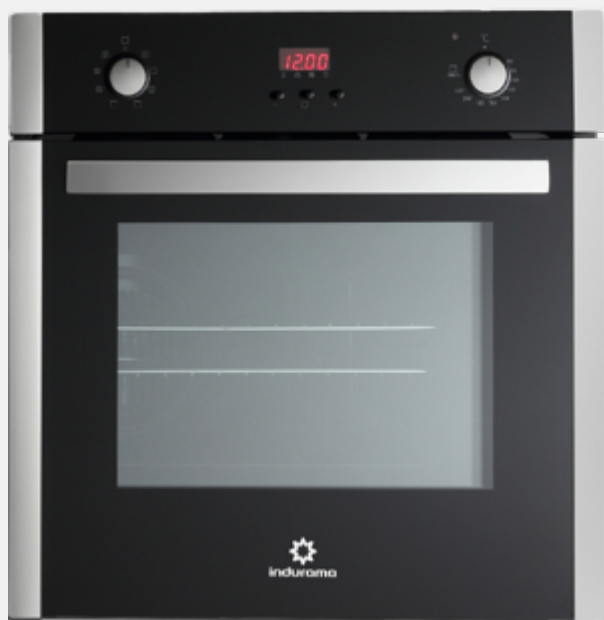
HORNO ELECTRICO HEI-60ENPD